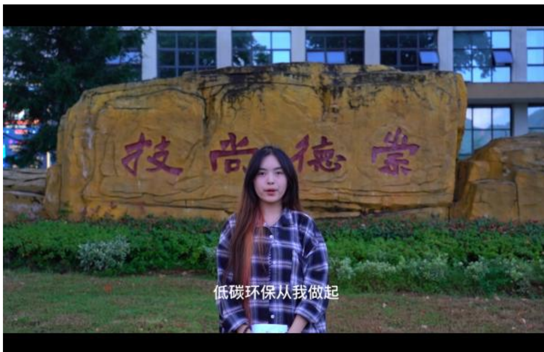
(贵州青少年低碳宣传活动——视频征集大赛作品：低碳生活·环保校园)