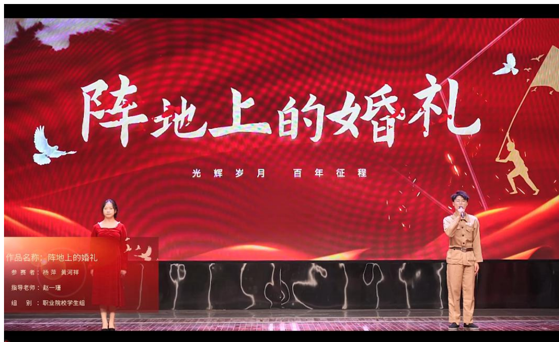
(朗诵节目: 阵地上的婚礼)

为学习宣传党的二十大精神, 贯彻落实习近平新时代中国特色社会主义思想, 抓好《中国共产党统一战线工作条例》落地落细, 根据《省委教育工委关于在全省教育系统持续开展“团结奋进新征程凝心聚力谱新篇”‘五个一’系列主题实践活动的通知》。我院团委根据文件通知要求, 在本月内完成两个作品录制视频后报送至省教育工委。