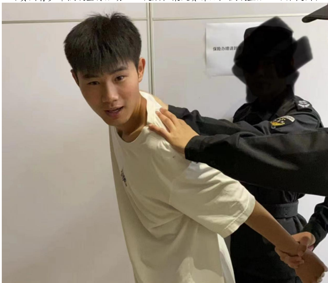
(短视频作品：宪法伴我健康成长)